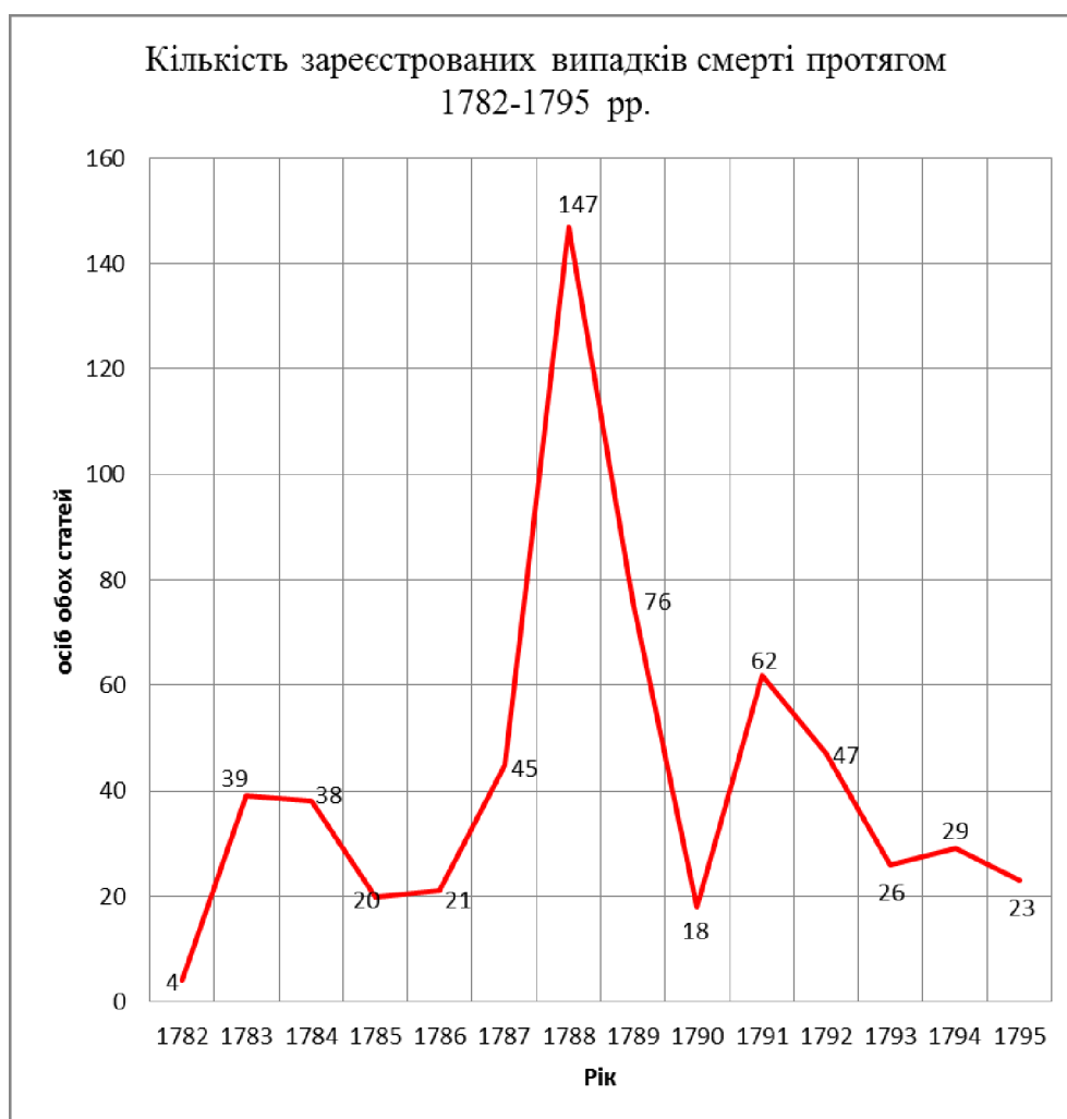
Рис. 1. Динаміка смертності військових обивателів у слободі Мартовій за 1782-1795 рр.

1795 рр. Існуючі заходи боротьби з інфекційними захворюваннями: використання симптоматичних ліків, ізоляція хворих в карантинних закладах, уникнення контактів з ними, знезараження зачумлених об'єктів, організація застав навколо зараженої місцевості, хоч і уповільнювали темпи поширення хвороби, однак надавали результати лише через деякий час [4, с. 82-90.]. Аби уникнути зараження на морову виразку, місцеві мешканці попри існуючу заборону намагались покинути зону зараження. У