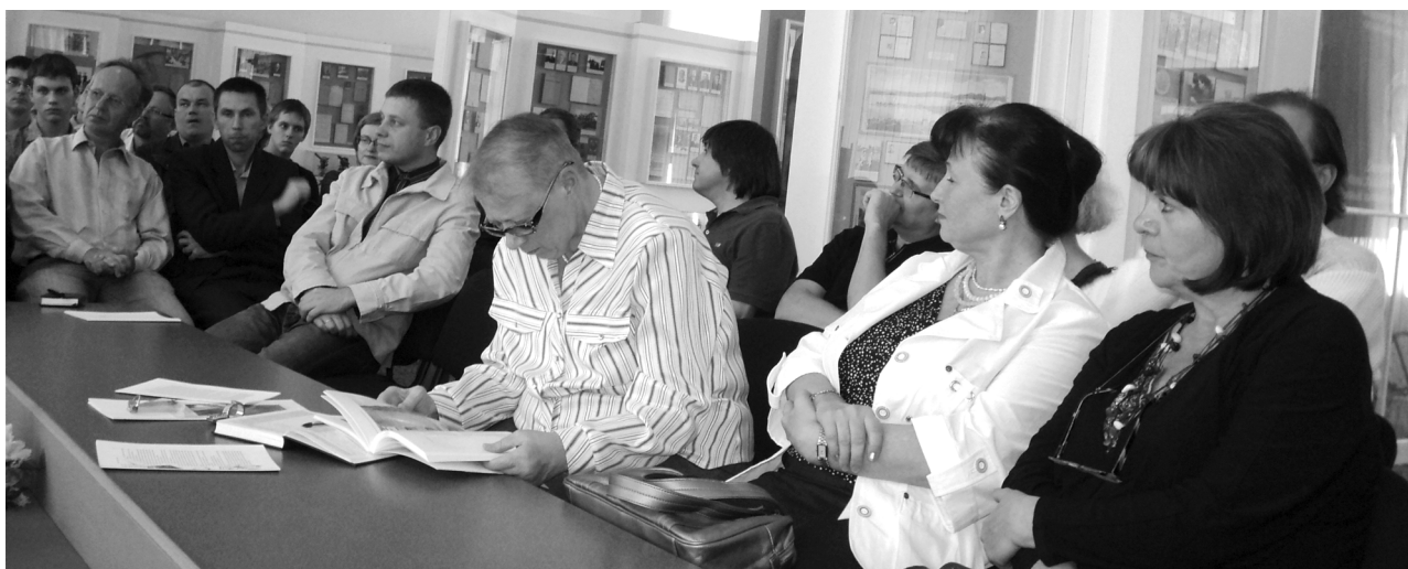
Засідання історико-краєзнавчого клубу «Грані». 20.09.2012 р.

Задля акумуляції зусиль дослідників у вивченні історії Придніпров'я керівництво ІГП ініціювало проведення щорічних регіональних краєзнавчих конференцій. Перша з них «Дослідники Придніпров'я ХІХ–ХХ ст.» відбулась у березні 2002 року. Частину матеріалів конференції було вміщено у 14-му номері «Гуманітарного журналу». У 2003 р. відбулась наступна конференція на тему «Пам'ятки історії і культури Придніпров'я», матеріали якої склали частину 17-го номеру журналу [5, с.148]. З кожним роком краєзнавча конференція, яка проводиться ІГП спільно з Дніпропетровською обласною організацією Національної спілки краєзнавців України набувала популярності серед дослідників. Тематика конференцій різноманітна: життя і діяльність видатних особистостей, проблемні питання історії міст і сіл, збереження історико-культурної спадщини та інші. Зазвичай під час роботи конференції розглядається вузьке коло питань, пов'язаних із визначеною темою. Однак тричі конференція присвячувалась помітним