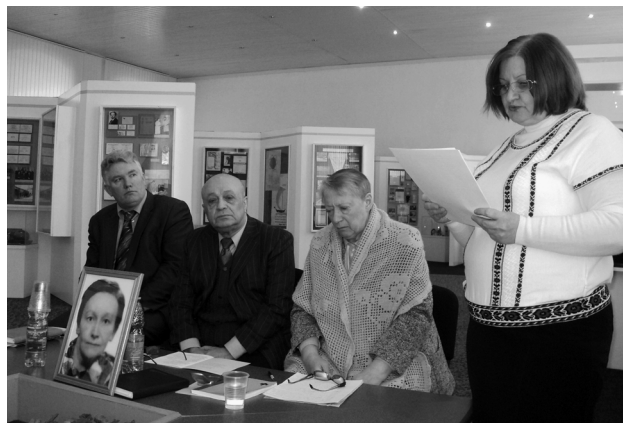
Краєзнавча конференція. 29.03.2013 р.