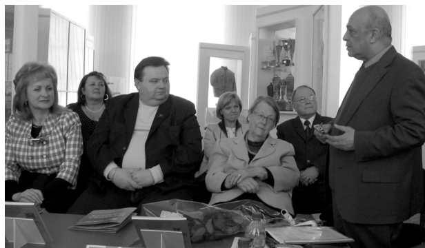
Засідання історико-краєзнавчого клубу «Грані». 24.04.2009 р.